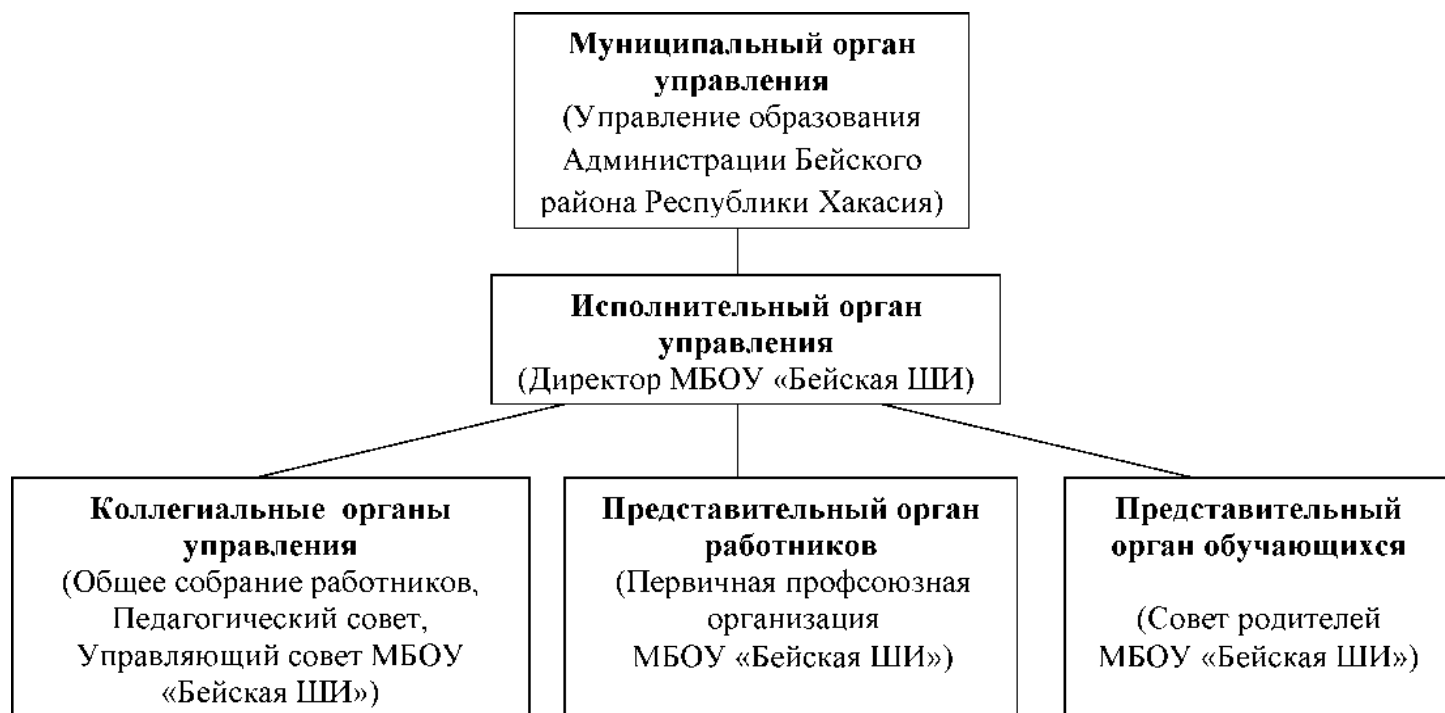
Схема структуры управления МБОУ «Бейская школа-интернат»